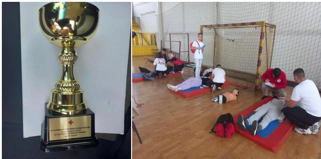
Слика 25 Натпревар по прва помош во категорија на средни училишта, во организација на Црвен крст, освоено трето место