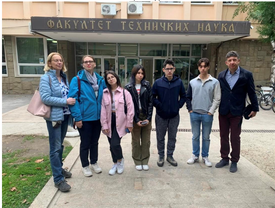
Слика 2 Посета на Факултетот во Нови Сад