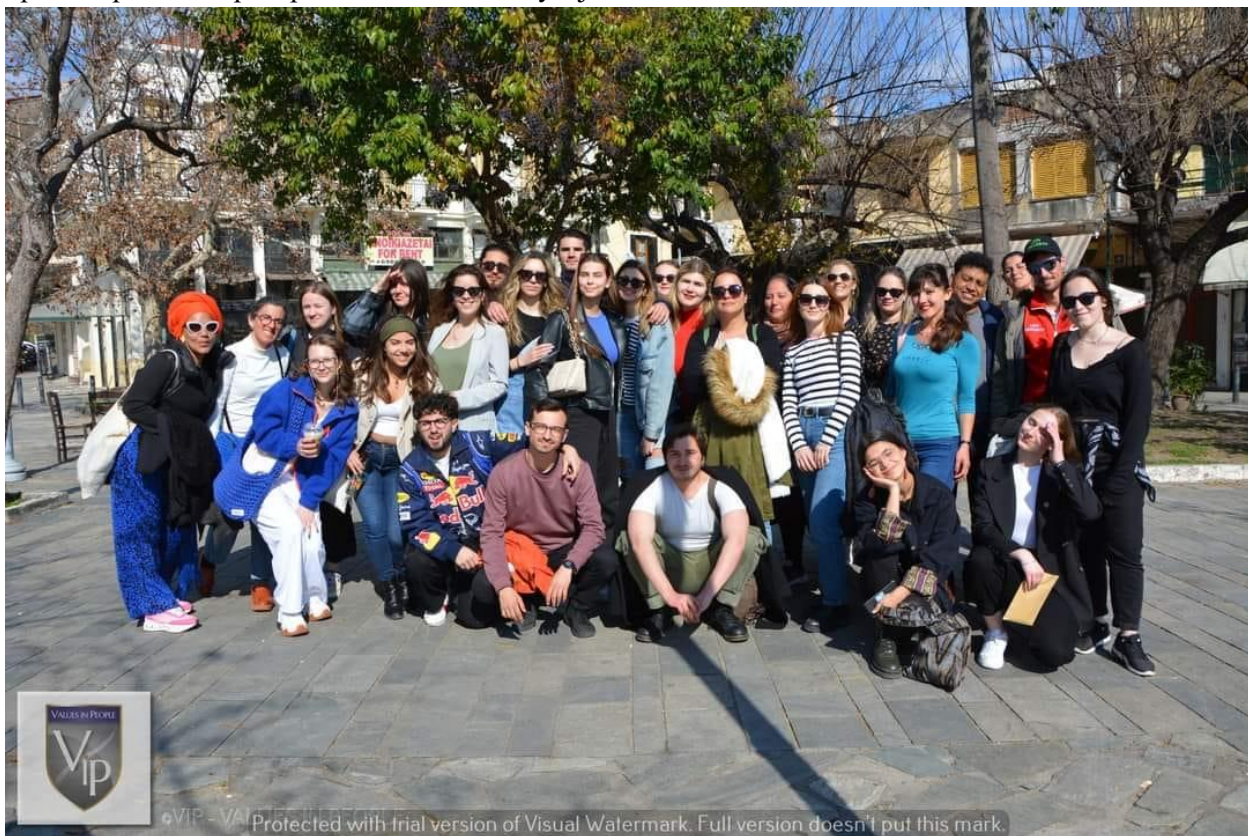
Слика 9 Еразмус+ проект – Boost your skills to help the neets во Каламата, Грција