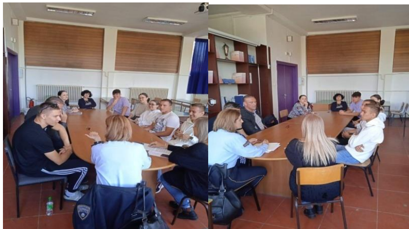
Слика 28 Проект "За безбеден град"

3. Согласно одржаната работна средба во врска со Проектот "За безбеден град" и дадените насоки од Раководителот на Сектор за образование на Град Скопје, одржавме работилница на 27.10.2022 година во 13.30 часот во нашето училиште СЕТУГС „Михајло Пупин“ Скопје со претставници од Одделението за превенција при СВР Скопје, претставници од Одделението за малолетничка деликвенција.