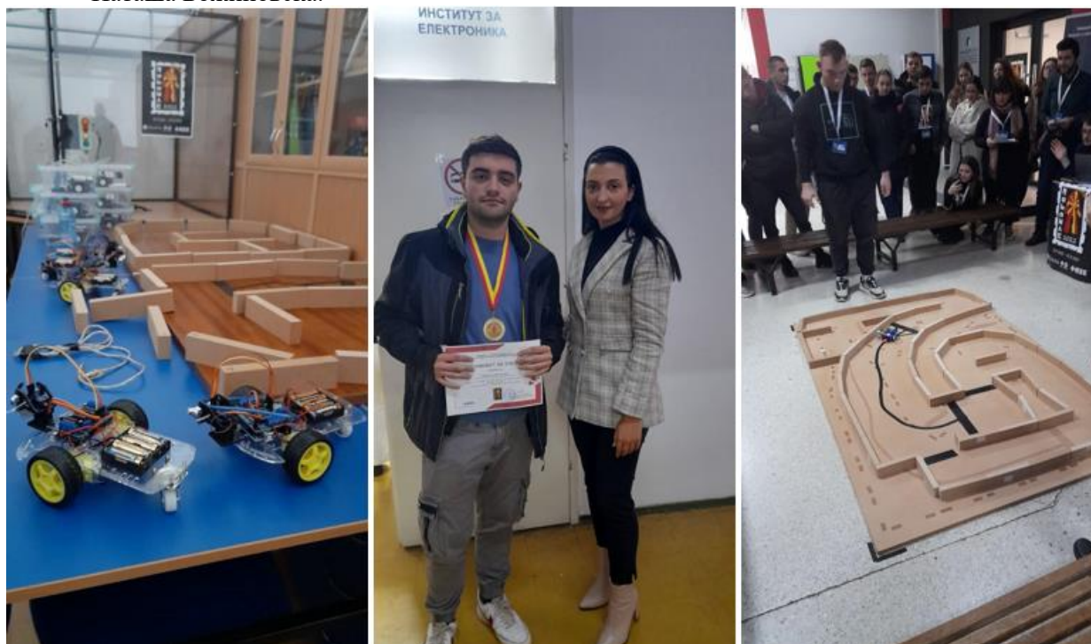
Слика 7 Освоено прво место на натпреварот ROBOMAC Junior