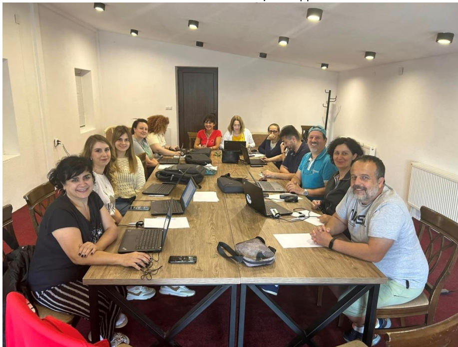
Слика 26 Тим за изработка на годишна програма за учебна 2023/2024