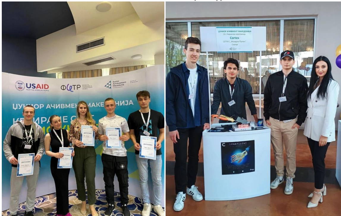
Слика 22 Национален натпревар на најдобри ученички компании – Џуниор Ачивмент Македонија во Струга, освоени прво и четврто место