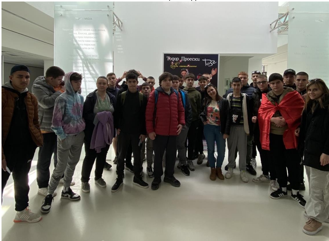
Слика 16 Посета на спомен куќата на Тоше Проески во Крушево