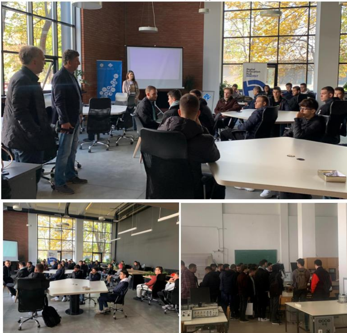
Слика 6 Посета на ФЕИТ