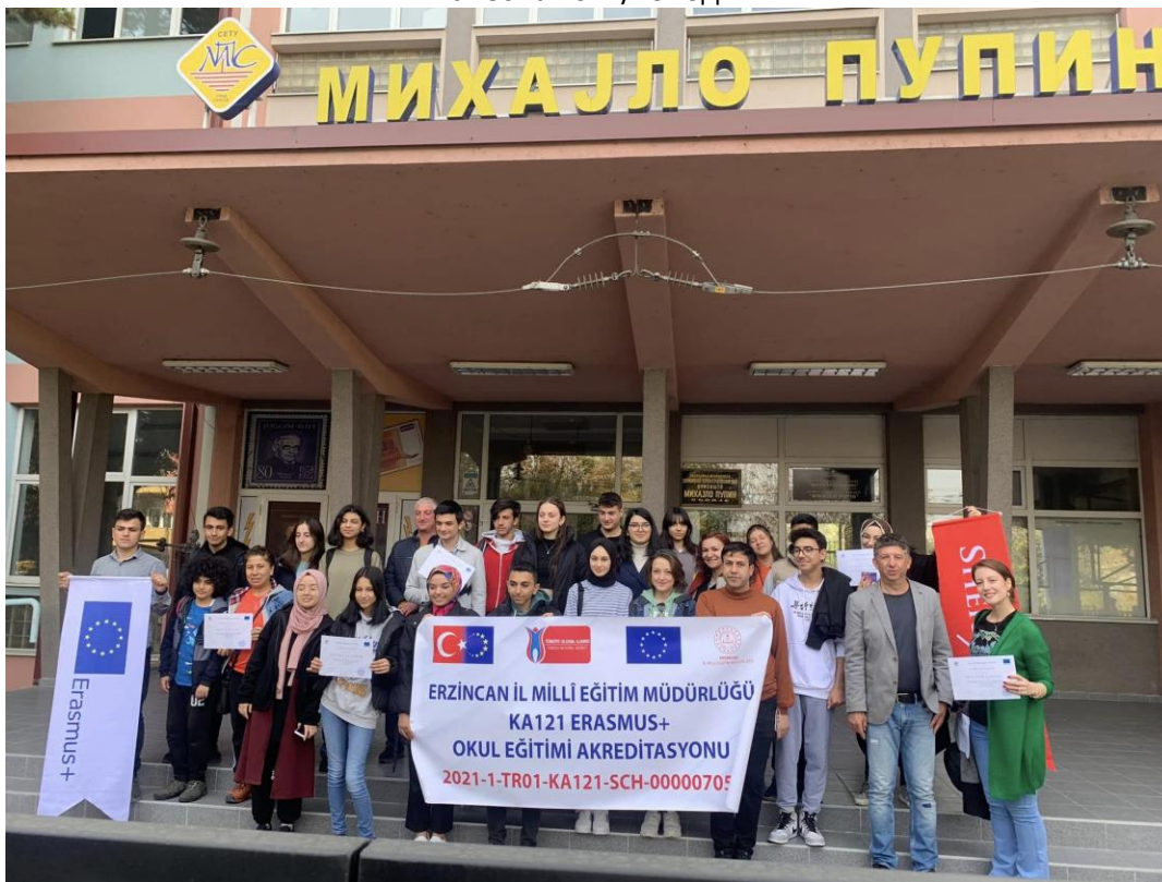
Слика 5 Посета на ученици и професори од Турција во рамките на проект од Ерасмус +