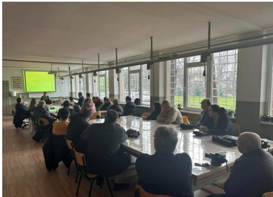
Слика 10 Обука за наставници од електротехничка струка – Енергетика во соработка со ЕВН