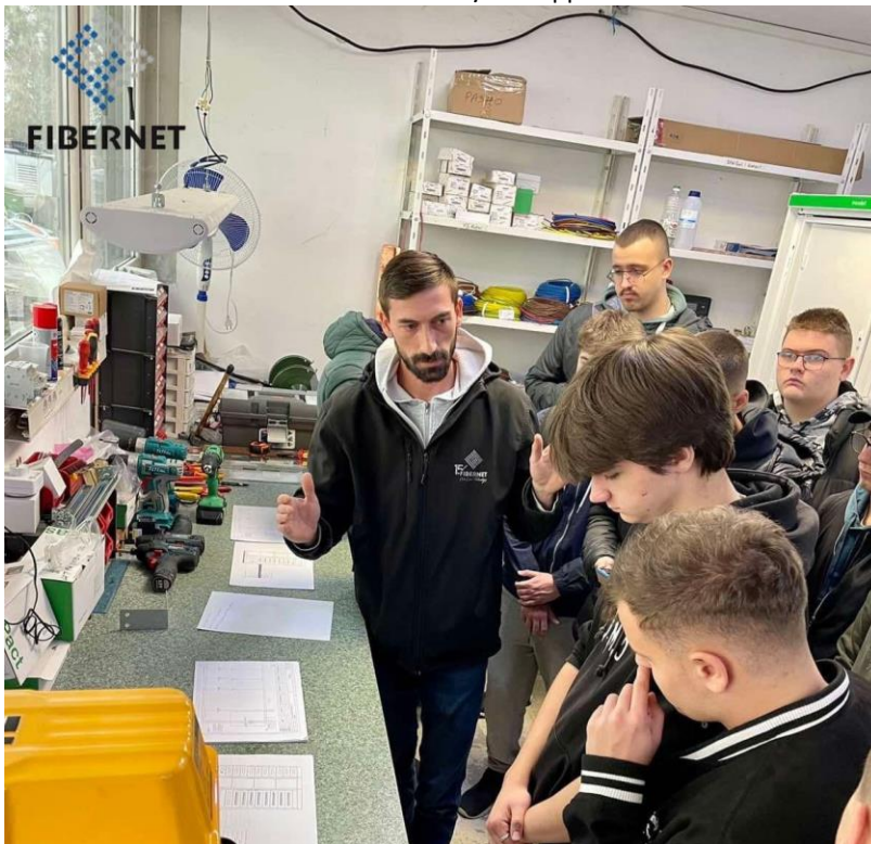
Слика 13 Посета на компанија FIBERNET М-К