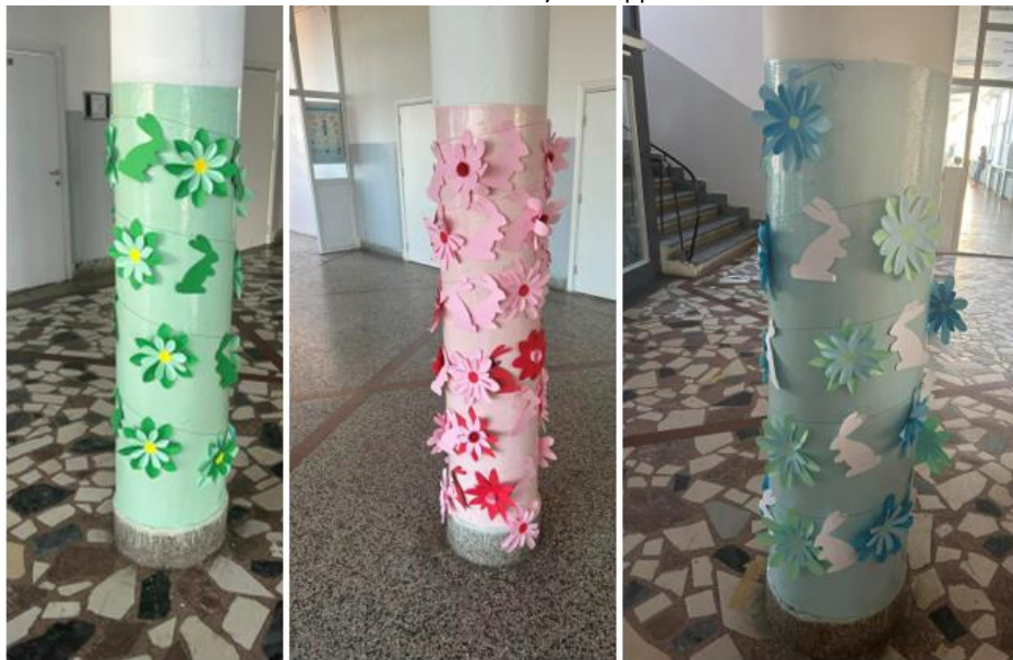
Слика 15 Декорација на училиштето по повод Велигденските празници