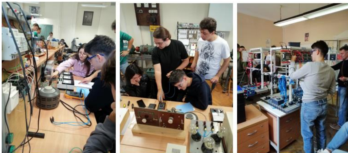
Слика 3 Размена на знаење и искуства во ЕТС “Михајло Пупин” Нови Сад