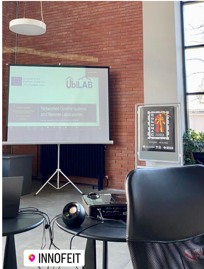
Слика 8 Обука за виртуелни лаборатории