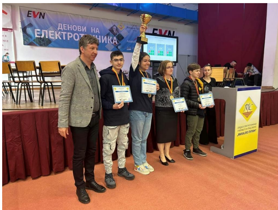
Слика 19 Победниците на финалето на Денови на електротехника – ученици од „Јан Амос Коменски“ – Карпош