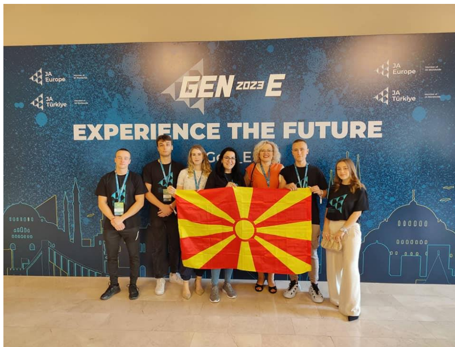
Слика 27 Учество на меѓународен натпревар за најдобри ученички компании во Истанбул, Турција