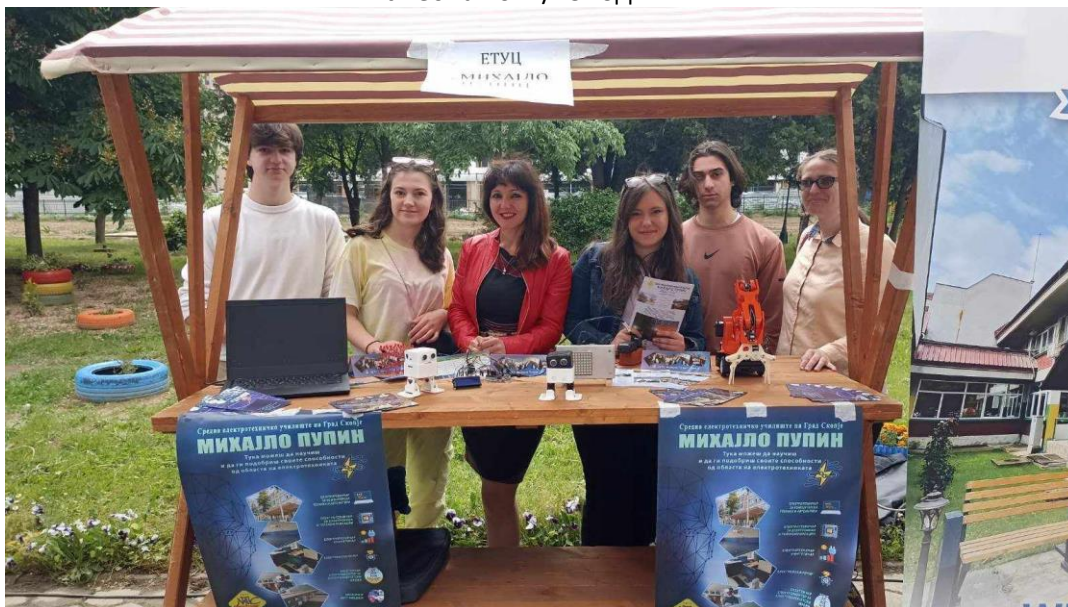
Слика 23 Презентација на училиштето во ООУ „Блаже Конески“ на Ден на занаетство