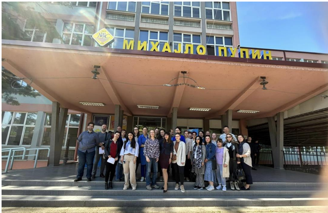
Слика 21 Отворен ден на училиштето