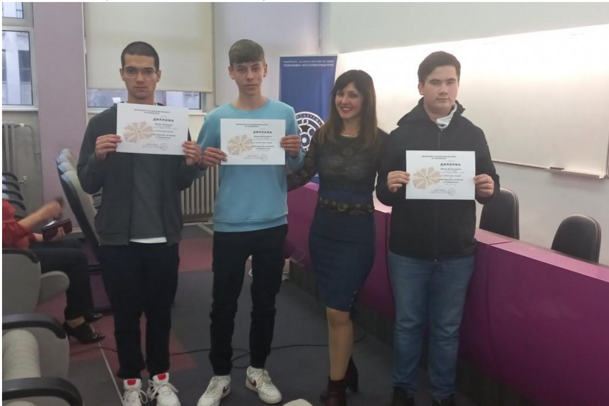
Слика 12 Државен натпревар по програмирање