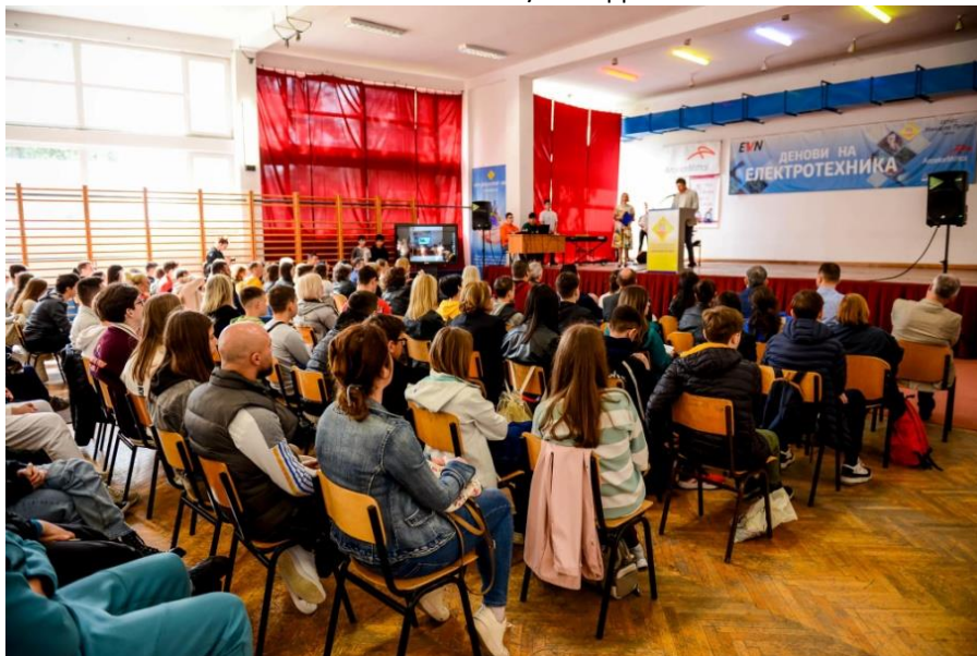
Слика 18 Денови на електротехника