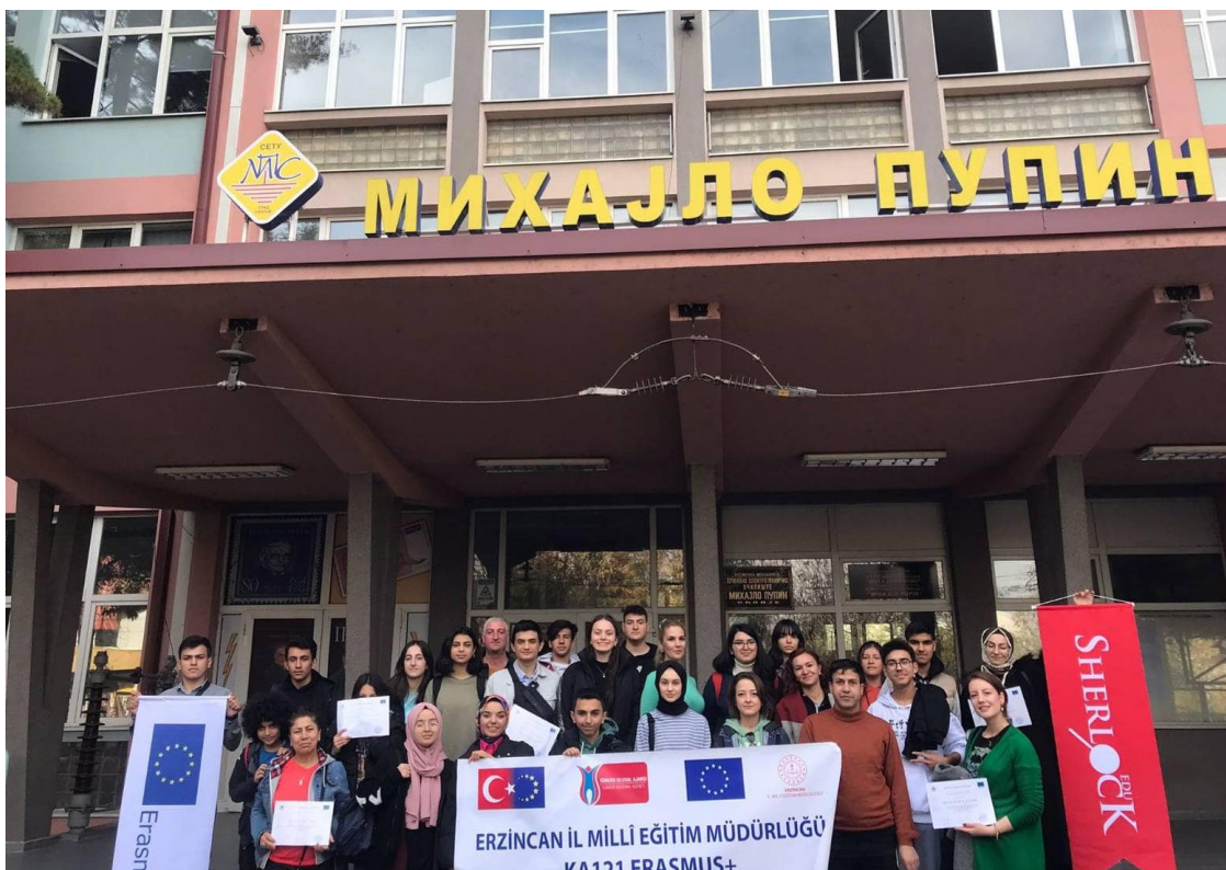
Слика 4 Посета на ученици и професори од Турција во рамките на проект од Ерасмус +