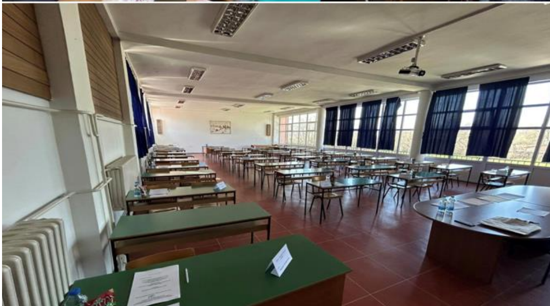
Слика 11 Регионален натпревар по електро, машинска и сообраќајна струка