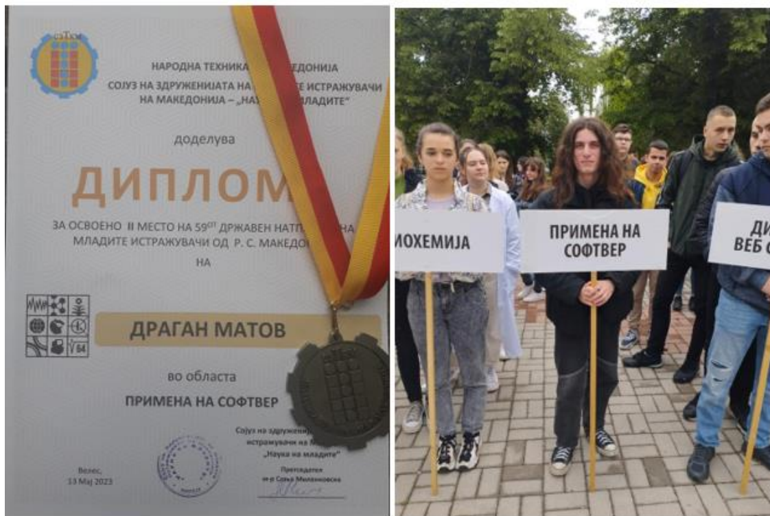
Слика 20 Диплома за освоено II место на Државниот натпревар од електротехничка струка