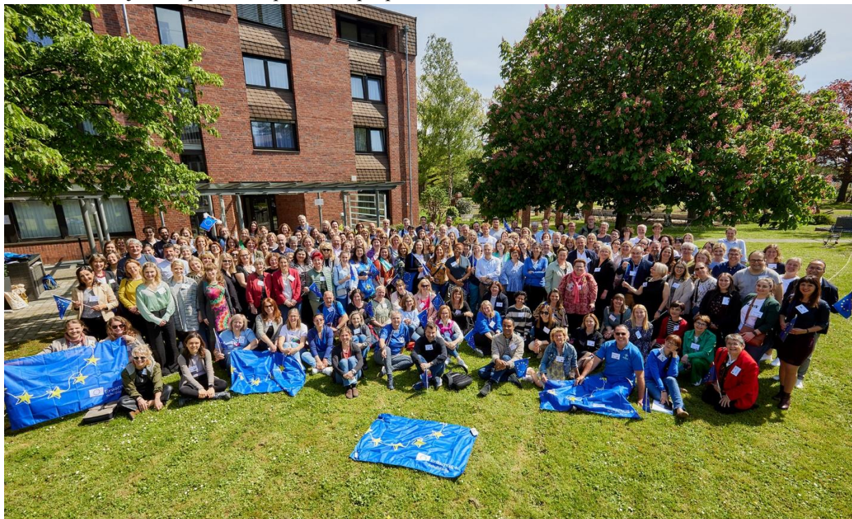
Слика 17 Учество на проектот „Schools go green and digital and Erasmus+ supports teaching excellence!“ во Бон, Германија