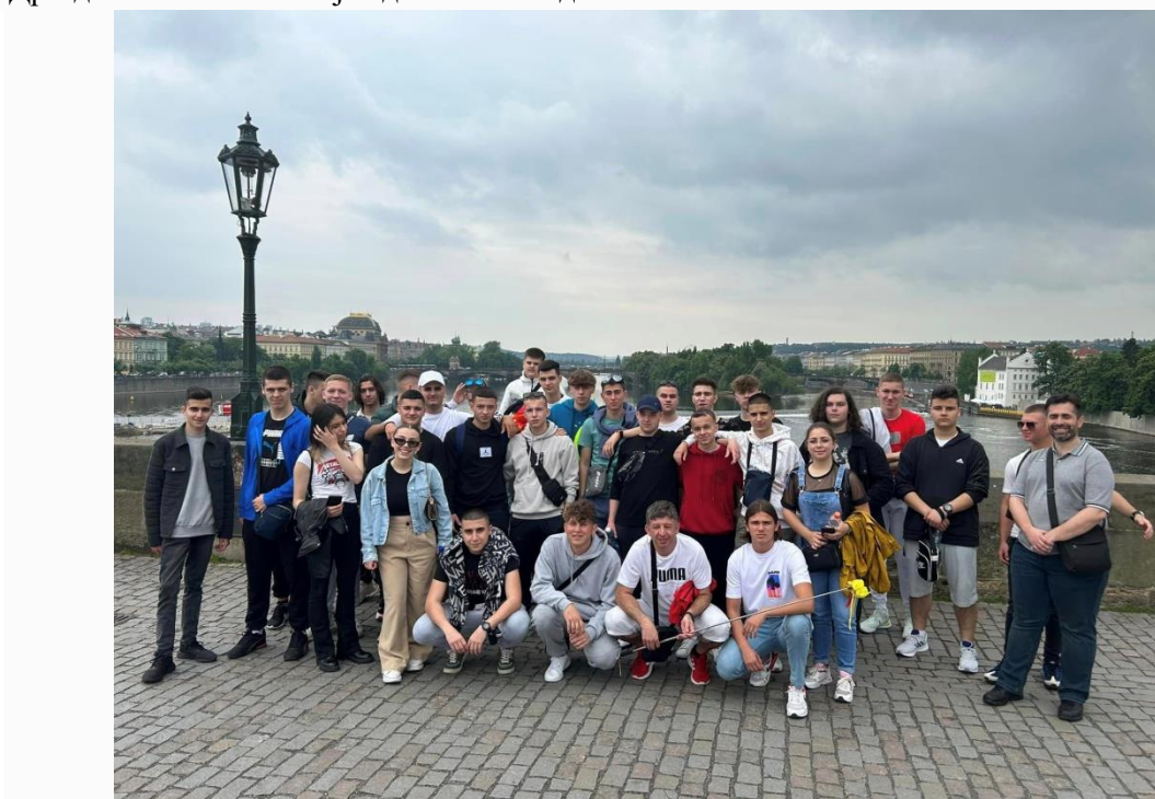
Слика 24 Завршна екскурзија со ученици од III година во релација Скопје – Прага – Дрезден - Виена – Скопје