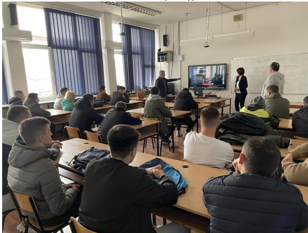
Слика 14 Обука од страна на компанијата МАКСТИЛ за Безбедност и заштита при работа